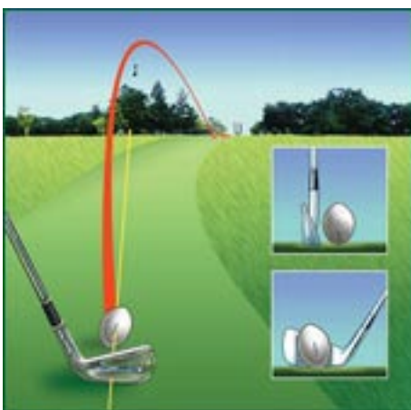
DIE FLUGBAHN DES BALLES WIRD DURCH DIE POSITIONIERUNG AUF DEM TEE CUP BESTIMMT